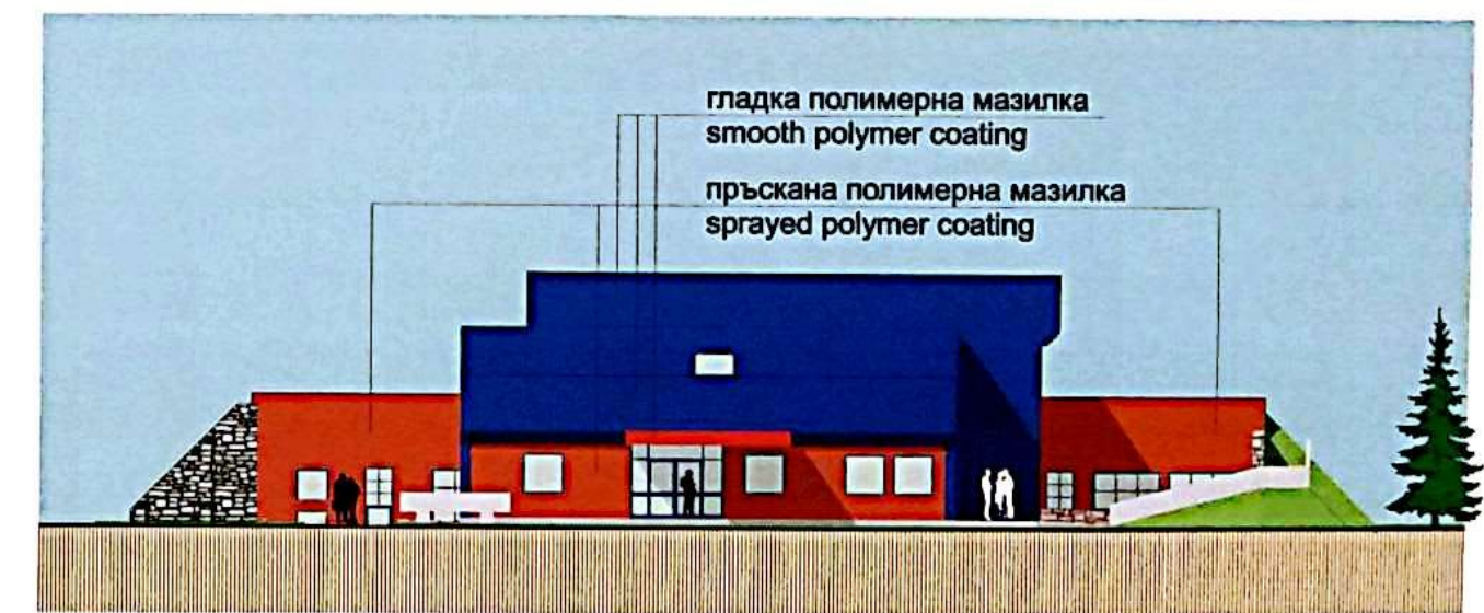
ФАСАДА ЮГОЗАПАД - FASADE SOUTHWEST