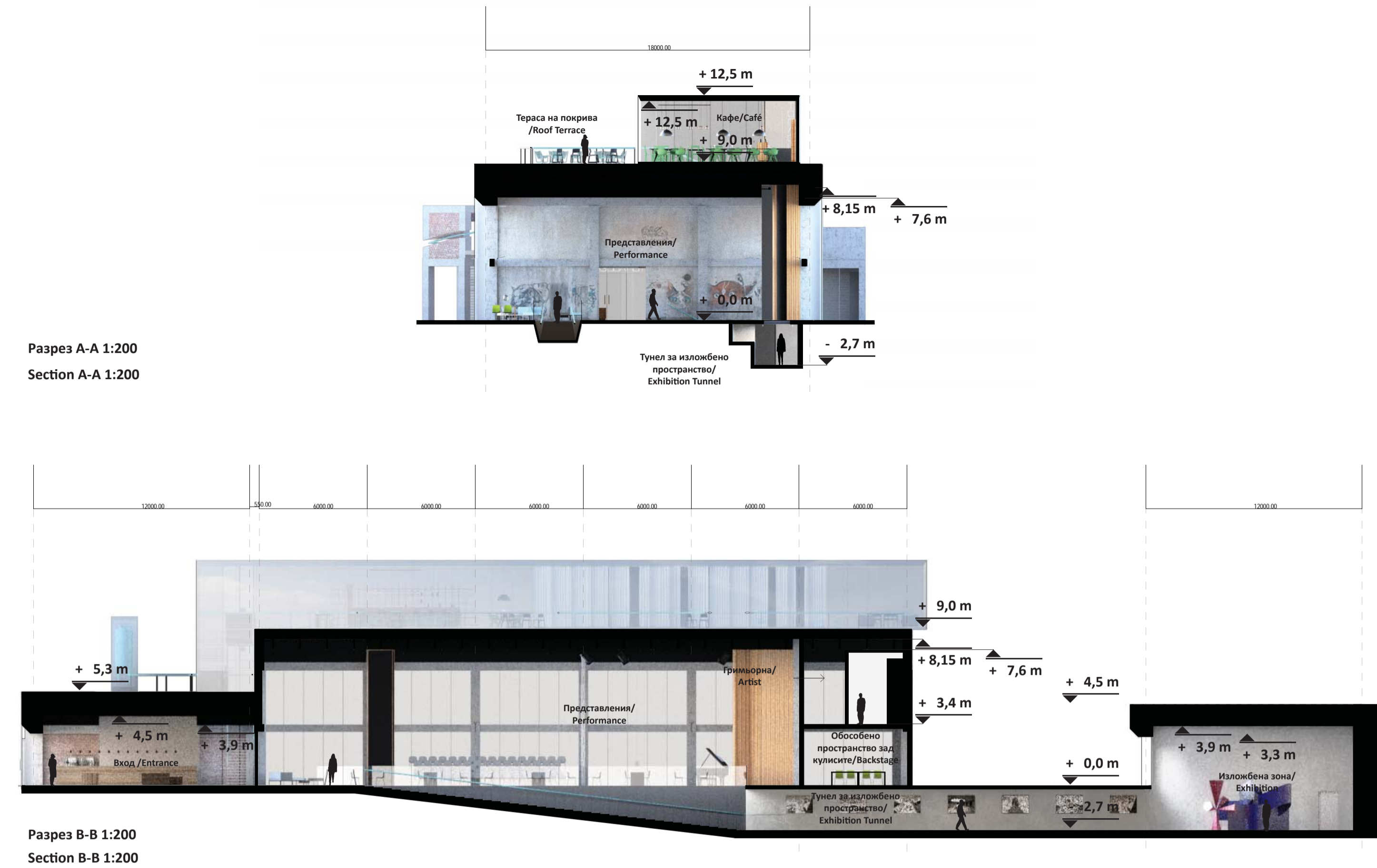
Разрез A-A 1:200 Section A-A 1:200