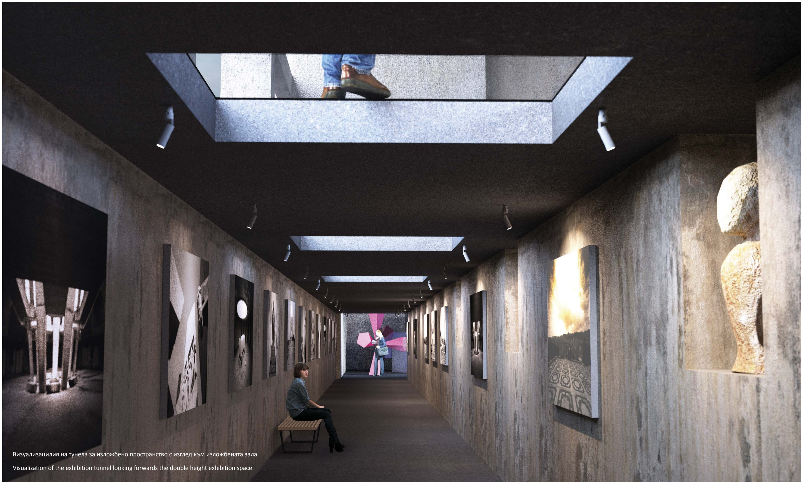
Визуализация на тунела за изложбено пространство с изглед към изложбената зала. Visualization of the exhibition tunnel looking forwards the double height exhibition space.